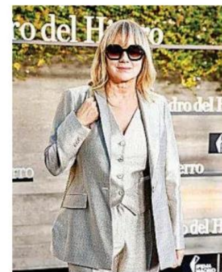
Emma Suárez.