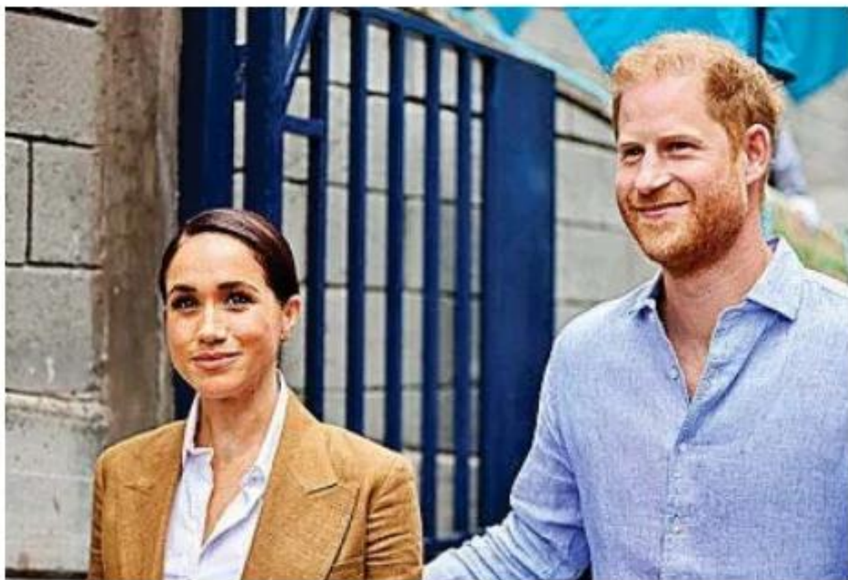
Meghan y Harry.