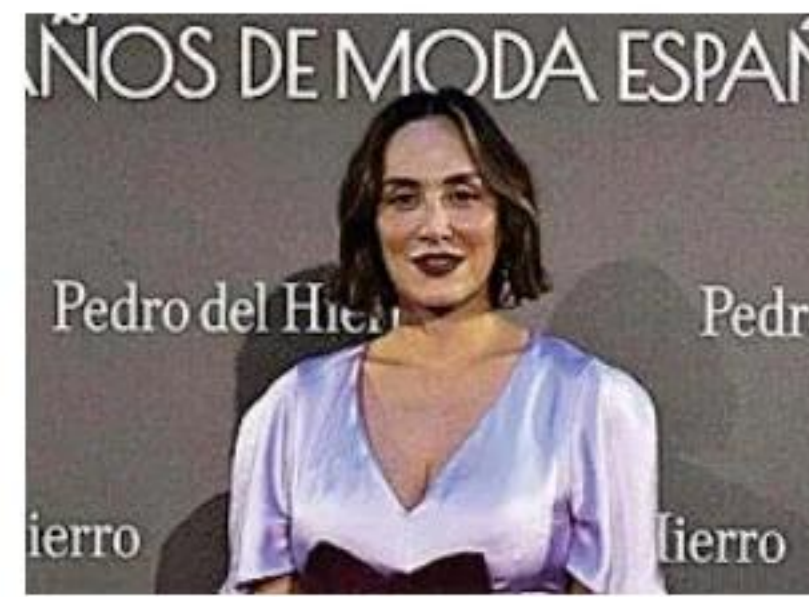
Tamara Falcó.