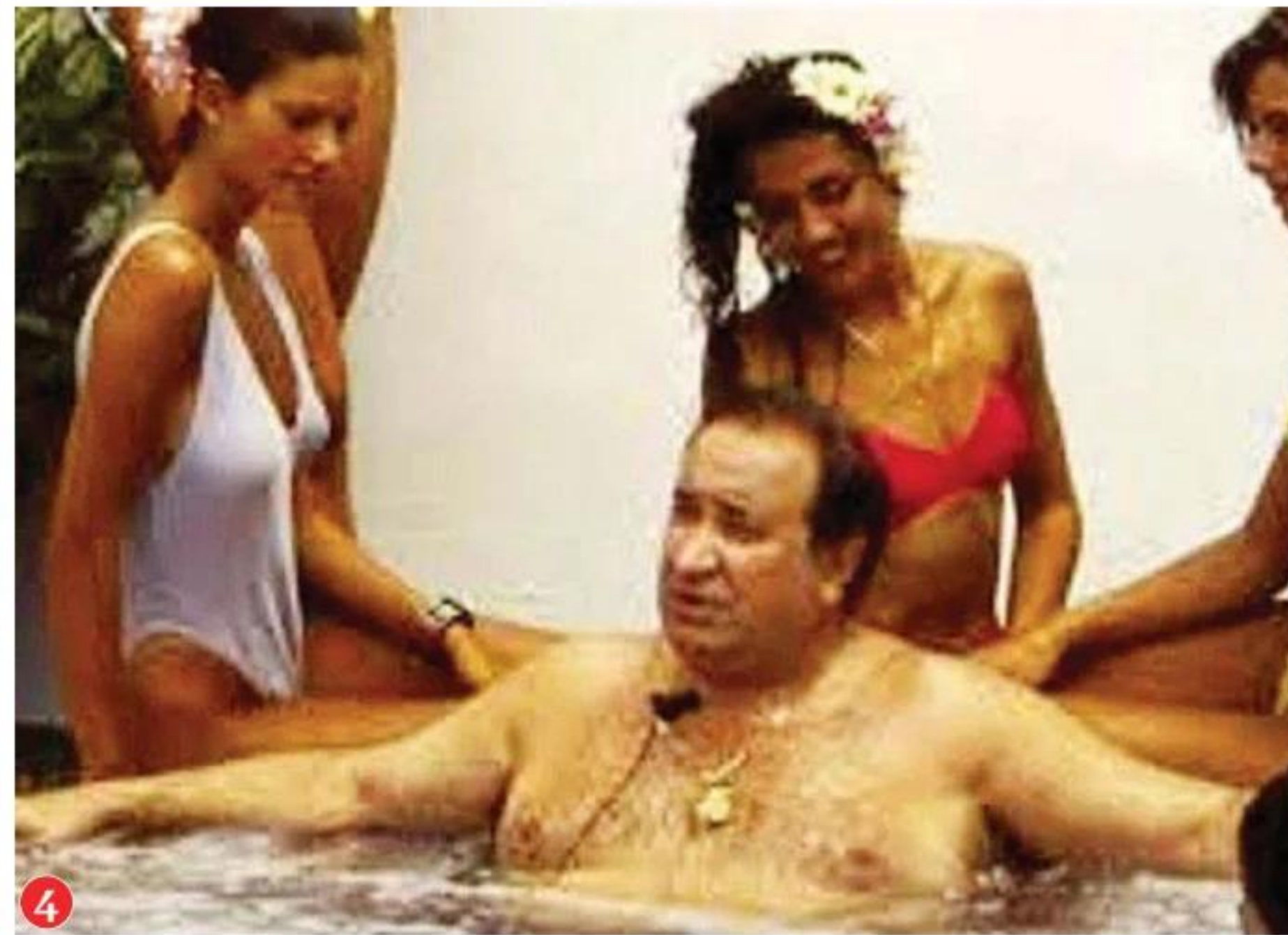
1. Tómbola se estrenó en 1997 con una entrevista a Chábeli de la que se marchó enfadadísima. 2. Bárbara Rey se abraza a Chelo García-Cortés después de confesar su noche de amor juntas. 3. Lola Flores suplicó a sus fans que abandonaran la iglesia de Marbella donde se casaba su hija Lolita en esos momentos ante una avalancha de gente. 4. Jesús Gil, rodeado de jovencitas en traje de baño en un jacuzzi.