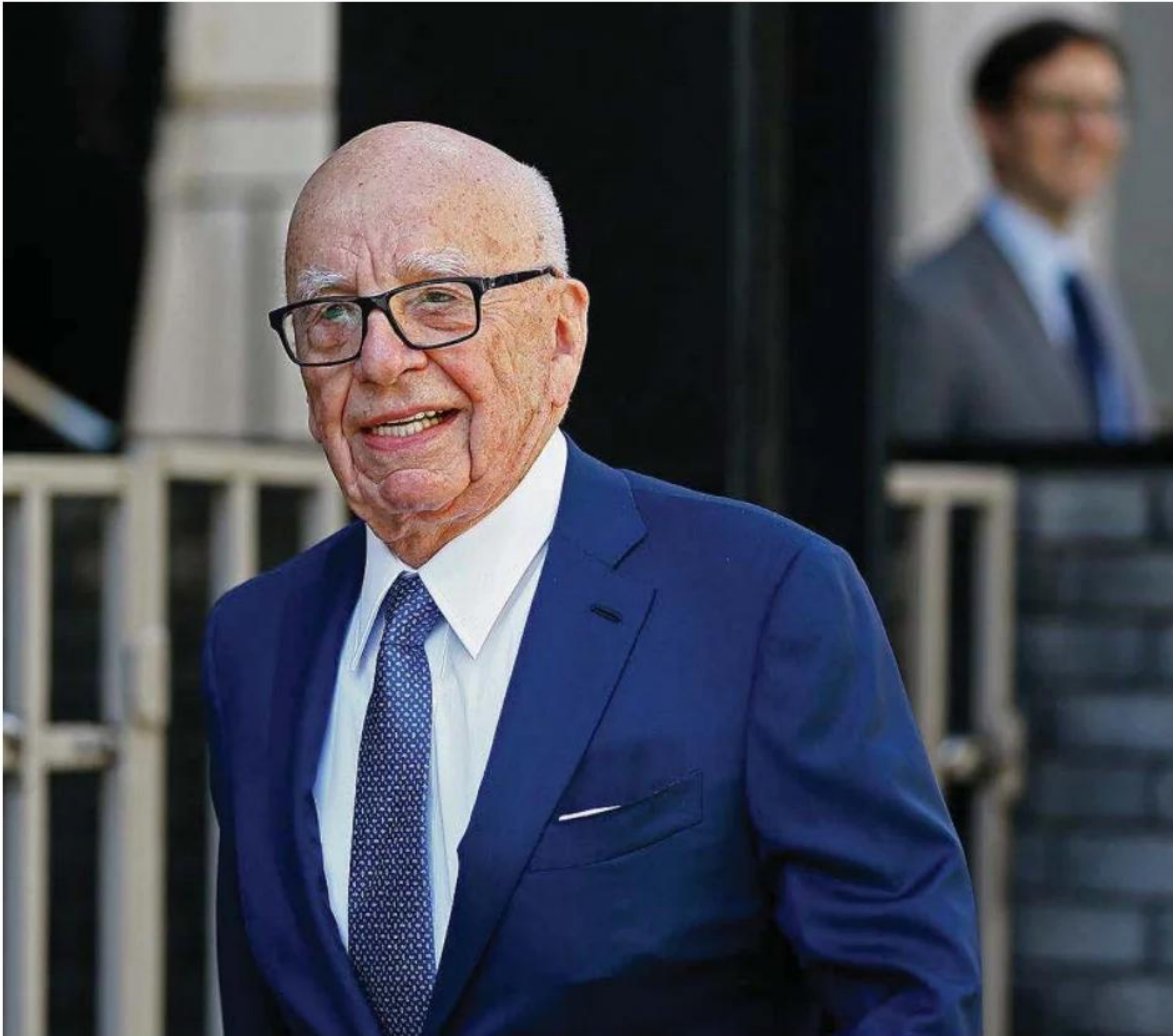
El millonario Rupert Murdoch a la salida de su casa en Londres.