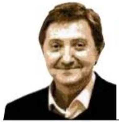
LAS CUATRO ESQUINAS FEDERICO JIMÉNEZ LOSANTOS

EL DISCUTIDO VÍDEO DE KATE MIDDLETON. La Casa Real Británica siempre da que hablar. Y pocas veces con tanto motivo como con el conmovedor vídeo de la Princesa de Gales anunciando el fin de nueve meses luchando contra el cáncer. La filmación, por su factura, podría anunciar una compresa, un secador de pelo o una funeraria. De hecho, en Londres algunos dicen que es una despedida de la enferma. A saber. Pero como tantas veces, lo sentimental oculta lo esencial: el rey también padece cáncer, desde antes de Kate, y si el mensaje buscado era el de ayudar a las familias a sobrevivir a la enfermedad, qué mejor que los reyes y los