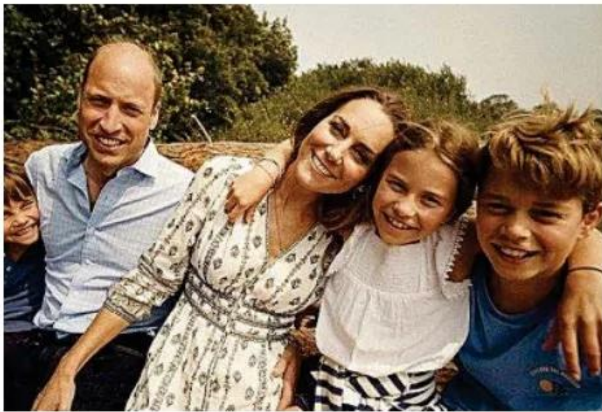
El vídeo de la princesa de Gales.

EL DISCUTIDO VÍDEO DE KATE MIDDLETON. La Casa Real Británica siempre da que hablar. Y pocas veces con tanto motivo como con el conmovedor vídeo de la Princesa de Gales anunciando el fin de nueve meses luchando contra el cáncer. La filmación, por su factura, podría anunciar una compresa, un secador de pelo o una funeraria. De hecho, en Londres algunos dicen que es una despedida de la enferma. A saber. Pero como tantas veces, lo sentimental oculta lo esencial: el rey también padece cáncer, desde antes de Kate, y si el mensaje buscado era el de ayudar a las familias a sobrevivir a la enfermedad, qué mejor que los reyes y los